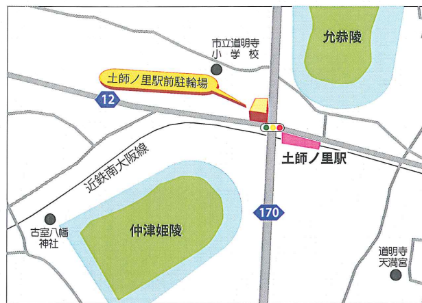
【近鉄南大阪線】土師ノ里駅下車、信号北側すぐ。